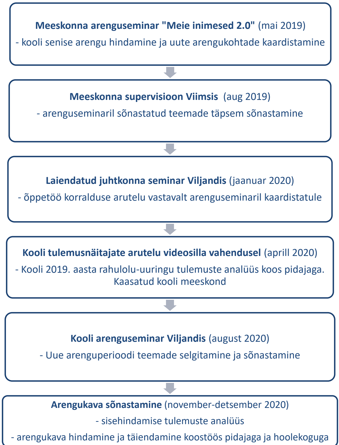
Skeem 1. Arengukava valmimisega seotud meeskonnategevused

Arengukava valmimise käigus toimunud koostööd iseloomustab järgnev skeem (Skeem 1).