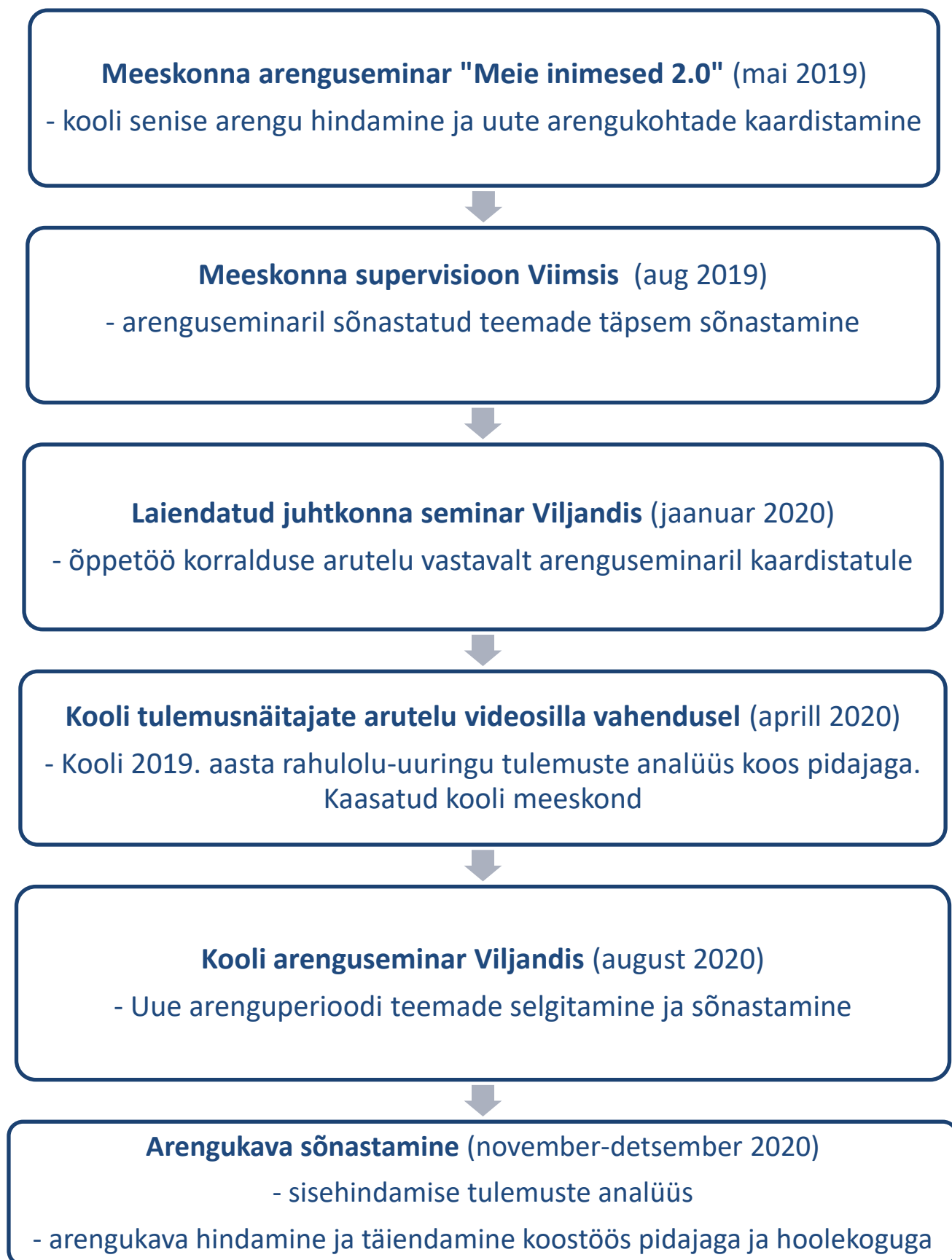
Skeem 1. Arengukava valmimisega seotud meeskonnategevused